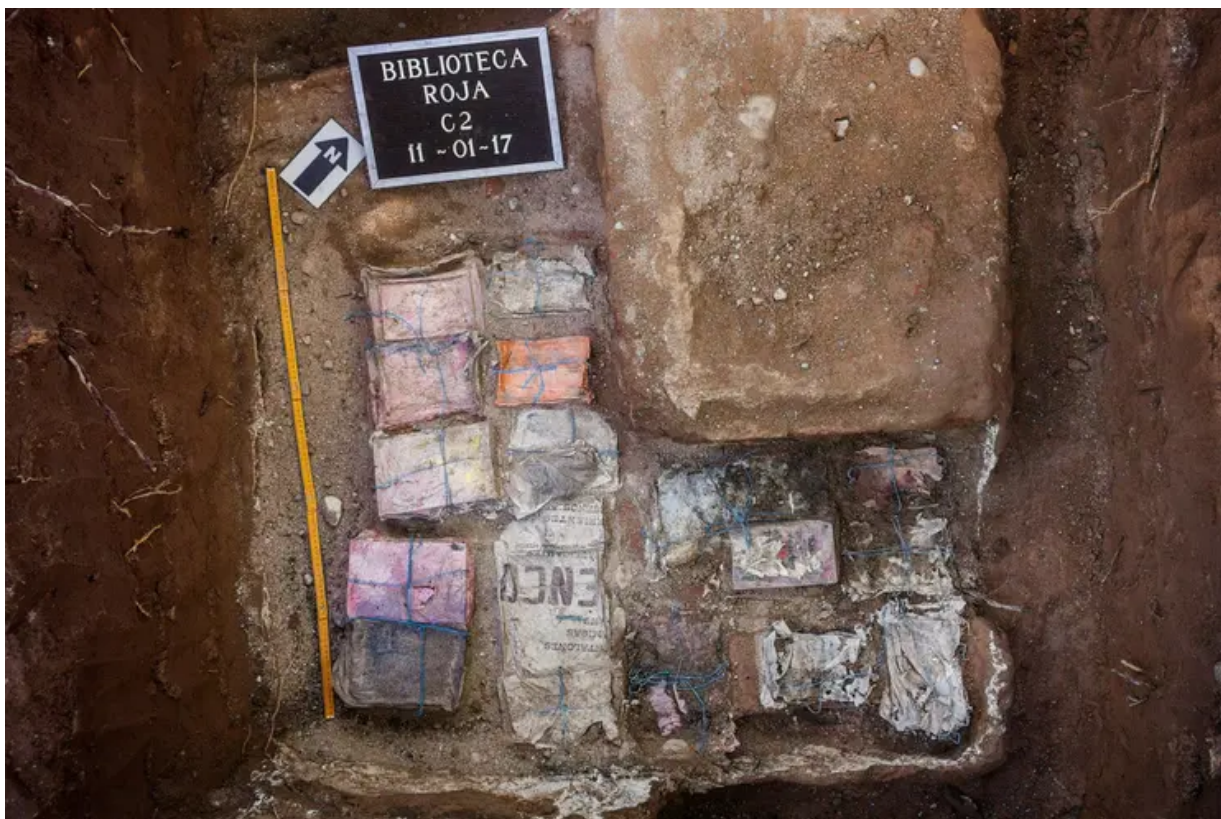
Papel y deriva. Un ensayo y sus ideas (detalle), fotografía de Rodrigo Fierro, ganadora del segundo premio del concurso Pampa Energía